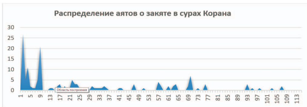
График 1.1. Распределение аятов о закяте в сурах Священного Корана Graph 1.1. Distribution of the ayats in the Holy Quran

В первую очередь поговорим о распределении аятов про закят в Коране. Графически это выглядит примерно так.